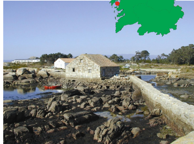
Aceia de marea na enseada da Brava. Contaba con tres moas, unha para trigo e dúas para millo.