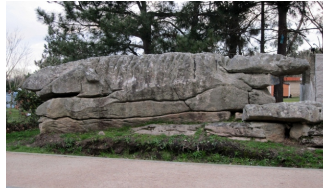
Con do Crocodilo