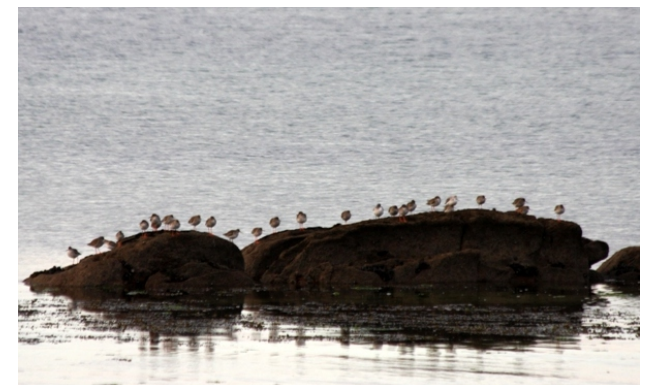
Biluricos no Carreirón.

Unha ruta circular seguindo a costa do sur da Illa de Arousa. Para gozar de paisaxes e dunha rica flora e fauna e elementos etnográficos (muíño de marea, embarcacións tradicionais). No extremo sur acolle o Espazo Natural “O Carreirón” incluído no LIC Ons-O Grove. Podemos deternos nalgunha das numerosas praias e se coincide marea baixa, e día laborable, observar os labores de marisqueo.