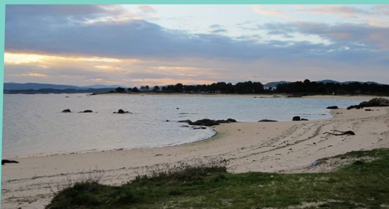
Praias da Camaxes e Xastelas

Despois de cruzar a ponte aparcamos á esquerda, no Vao. A ruta segue a costa interior da Illa de Arousa ata chegar á punta de Xastelas, xa dentro do espazo protexido, e volve pola parte que mira cara á Ría exterior. Desde a entrada do Carreirón hai que seguir un sendeiro pola beira do mar ata chegar ás proximidades do muíño de marea e desde alí por diferentes pistas achegándonos sempre á costa. Volvemos ao Vao cruzando a estrada e seguíndoa ata que se poida pasar ao outro lado.